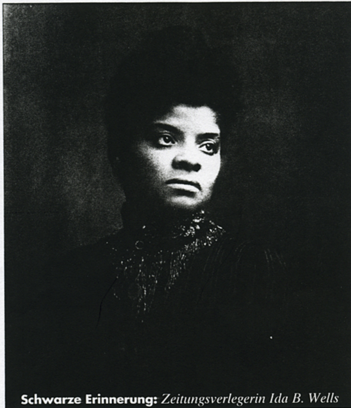
Schwarze Erinnerung: Zeitungsvorlegerin Ida B. Wells

A ls Ida B. Wells, eine afro-amerikanische Zeitungsvorlegerin und Bürgerrechtlerin, 1893 die dem 400jährigen Jubiläum seit der Entdeckung Amerikas gewidmete Weltausstellung in Chicago besuchte, war sie mehr als enttäuscht. In keinem einzigen Pavillon waren die Leistungen der schwarzen Amerikaner für die Vereinigten Staaten gewürdigt worden. Dabei war es seit der Sklaverei für die Schwarzen Amerikas schwer genug gewesen, überhaupt zu den Positionen zu gelangen, von denen aus sie Einfluß auf die gesellschaftliche Entwicklung nehmen konnten. Immer wieder wurden zu Lebenszeiten Ida B. Wells' (1862-1931) schwarze Kaufleute von erfolglosen weißen Mitkonkurrenten drangsaliert, mit parteiischen Gerichtsurteilen gedemütigt und sogar durch heimtückische Lynchmorde in Angst und Schrecken versetzt. Kein Wunder, daß bei stets schlechteren Startbedingungen das heutige Bild Schwarz-Amerikas mehr als deprimierend ist. Obwohl nur rund zwölf Prozent der US-Bevölkerung Afro-amerikaner sind, ist ihr Anteil an denen, die unterhalb der Ar-